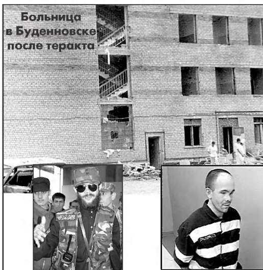
Радуев до Кизляра и после...

Потом были другие многочисленные кровавые теракты. Но у событий в Буденновске и Кизляре — особый трагизм. Поэтому их называют первыми горькими уроками борьбы с террором в России. Они показали звериную сущность людей, которые добиваются своих политических целей человеческими средствами.