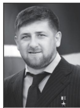
Президент Чечни Рамзан Кадыров держит слово: тех, кто не сложил оружие, он уничтожает

В чем теперь должны быть уверены сепаратисты, готовые, например, захват заложников?